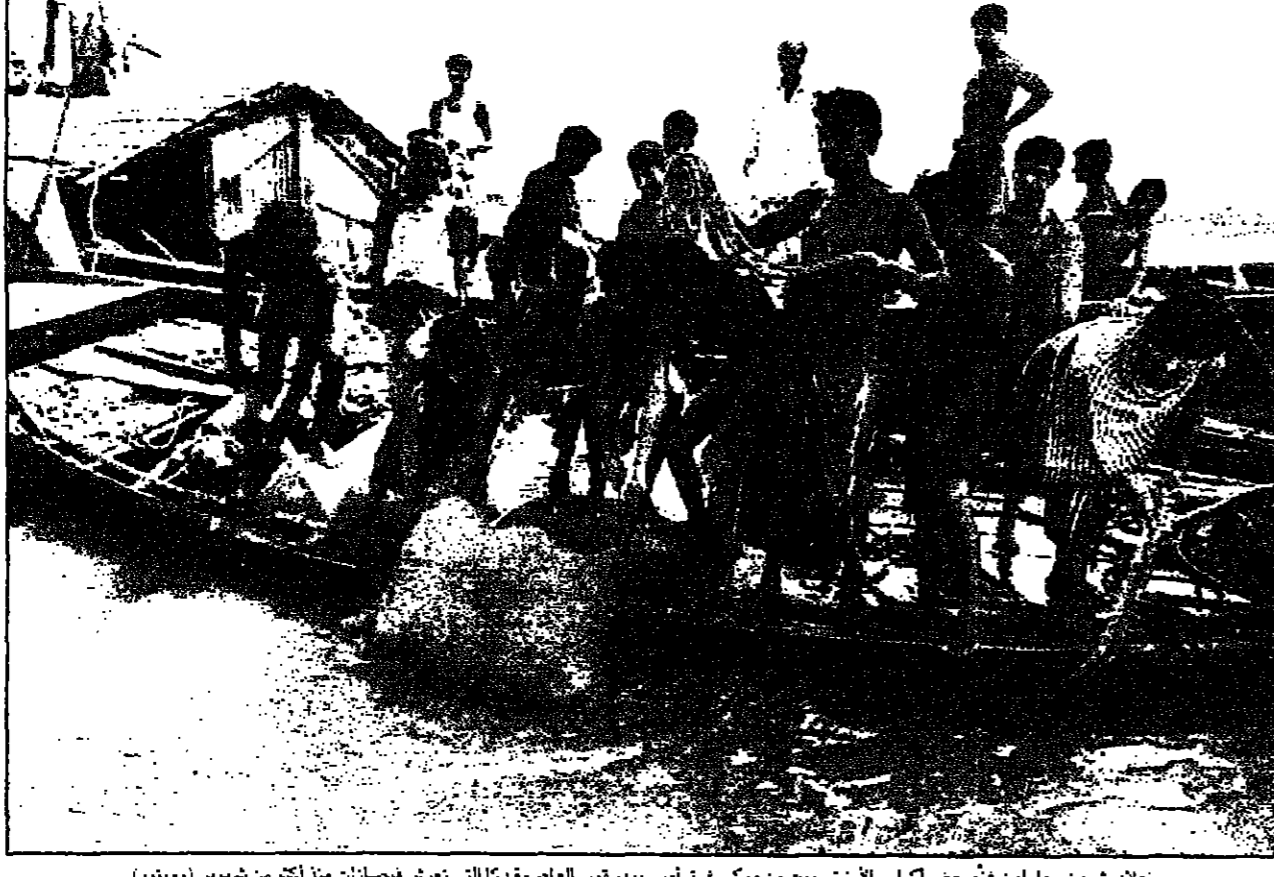
مخاضيون يحاولون غم بعض كيباس الأوزن تحت مركبة غرق أسير قبر العاصمة دكا التي تعيش فيضانات منذ أكثر من شهرين